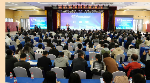
10月21日,京津冀高校建筑科技发展大会在北京建筑大学召开