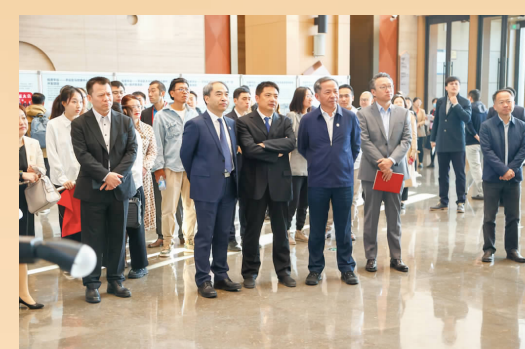
10月26日,北京建筑大学参与主办的“2023北京·平谷城市发展论坛”在平谷区金海湖国际会展中心顺利举办