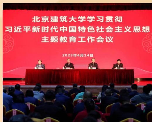
北建大召开学习贯彻习近平新时代中国特色社会主义思想主题教育工作会议