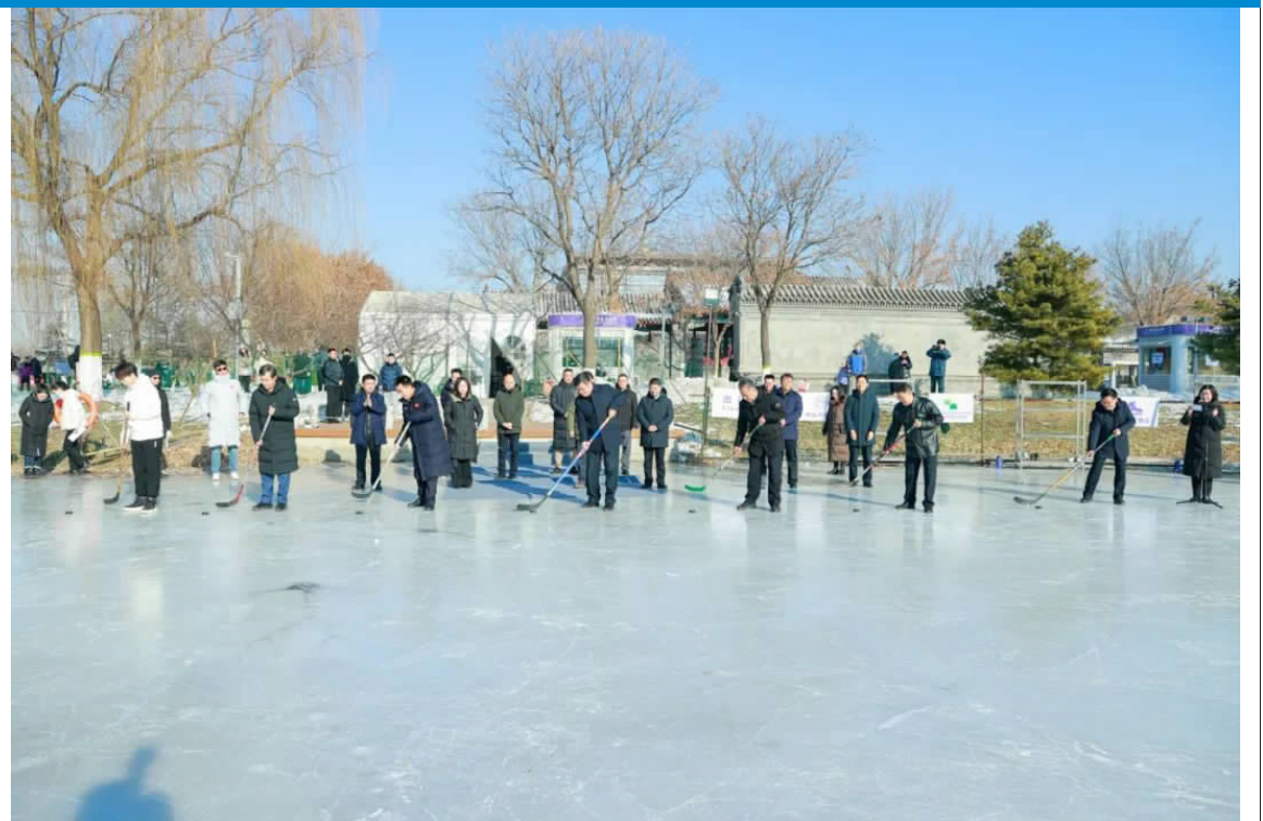
与会嘉宾在冰场开滑