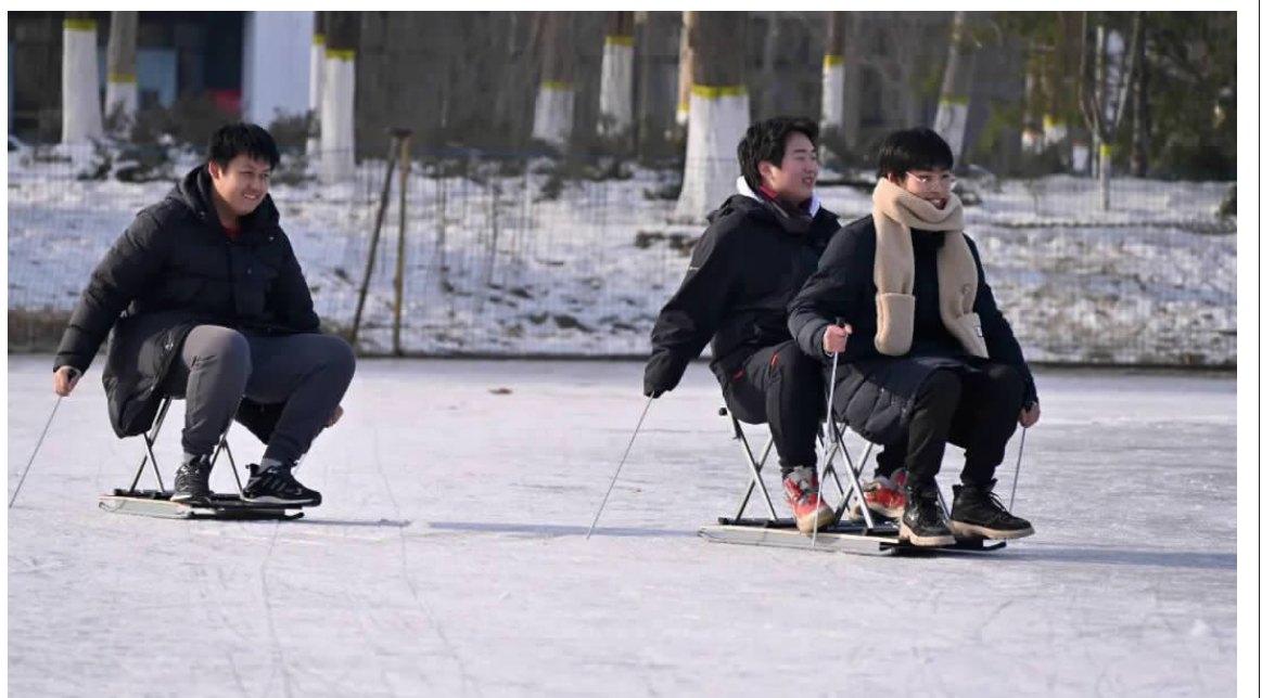
北建大学生在明湖冰场开展冰雪运动

北京市体育局青少年体育处处长于立超表示，明湖冰场项目体现了学校积极探索校园育人资源聚集、空间利用的新机制，多部门齐抓共管、联动协调的育人体系，在大学生群体中积极推广普及冰上运动，能增强大学生身心健康，营造健康向上的校园文化氛围。学校应坚持“五育融合”，充分发挥明湖冰场育人效能，强化责任担当，守牢安全防线，做好冰面安全巡查与巡检工作和上冰人员的安全培训工作，有序组织引导冰上活动的开展，打造好彰显建大特色的明湖冰场文化品牌，利用冰场服务社会，繁荣京南地区冰雪文化。