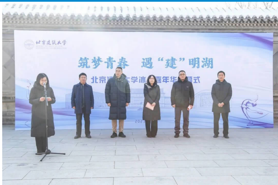
“筑梦青春 遇‘建’明湖”北京建筑大学冰上嘉年华开幕