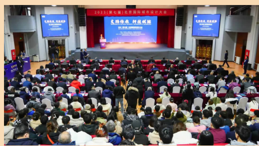
2023(第七届)北京国际城市设计大会会场

2023年,学校科研工作再创历史新高:北建大“古建筑安全与节能国际合作联合实验室”获批立项建设,这是学校获得的首个由国家部委批准立项建设的国际合作联合实验室,也是北京市属高校中唯一的教育部国际合作联合实验室;召开2023(第七届)北京国际城市设计大会、京津冀高校建筑科技发展大会、京南地区高校科技成果推介会等高级别活动,科研创新再创新高。