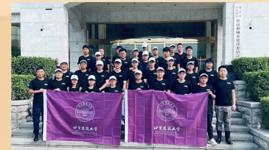
北建大派出首支队伍紧急支援灾后重建工作

社会服务是高校重要职能之一,学校立足首都,坚持人才培养与社会服务相统一。今年夏季门头沟区、房山区灾情严重,学校以最快速度集结最强力量,率先成立工作组,进驻妙峰山镇开展灾害评估,彰显了北建大人的情怀与担当。今年冬季,学校向社会开放明湖冰场,让周边市民享受冬日乐趣。