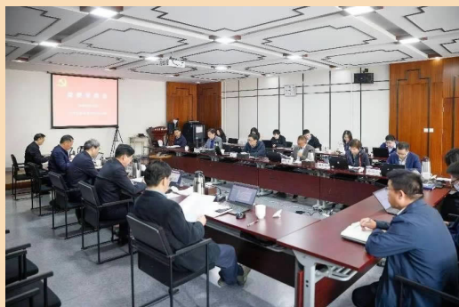
4月10日,北建大召开党委常委会传达学习习近平总书记重要讲话精神、研究部署开展主题教育工作

“学思想、强党性、重实践、建新功”是主题教育的总要求,学校坚持学思用贯通、知信行统一,把习近平新时代中国特色社会主义思想转化为推动全校师生员工坚定理想、锤炼党性和指导实践、推动工作的强大力量。