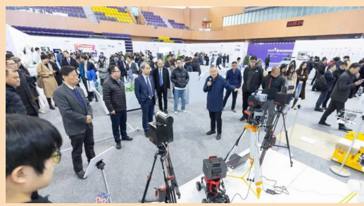
2023京南地区高校科技成果推介会