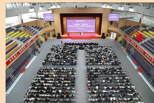
北京建筑大学召开第39个教师节表彰庆祝大会