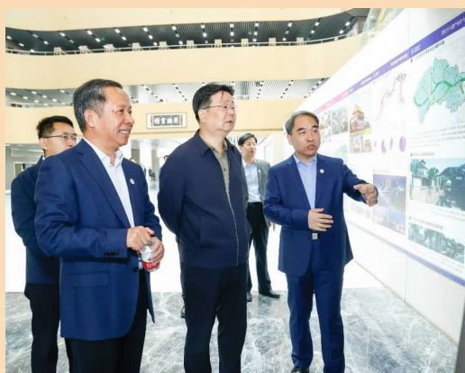
5月3日,时任市委常委、市委教育工委书记游钧来到北京建筑大学调研