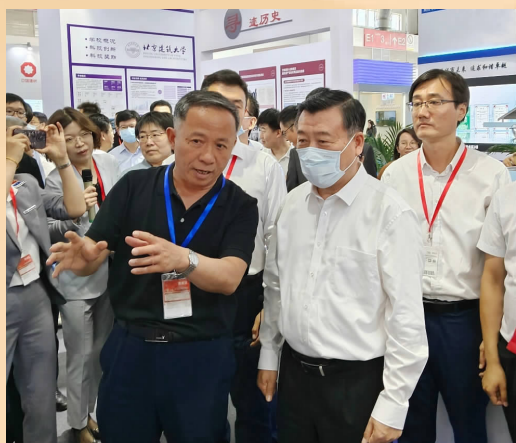
6月21日,住房和城乡建设部党组书记、部长倪虹莅临北京建筑大学展区视察指导

北建大是北京市人民政府与住房和城乡建设部共建高校。2023年,住建部、北京市各级领导多次到学校调研,指导学校事业高质量发展。