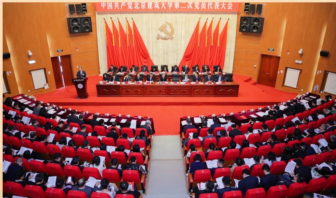
中国共产党北京建筑大学第二次党员代表大会盛况