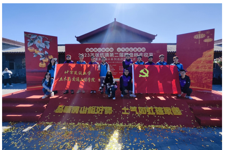
土木学院“方圆先锋”实践团深入房山区大峪沟村,探索青年服务乡村振兴路径。