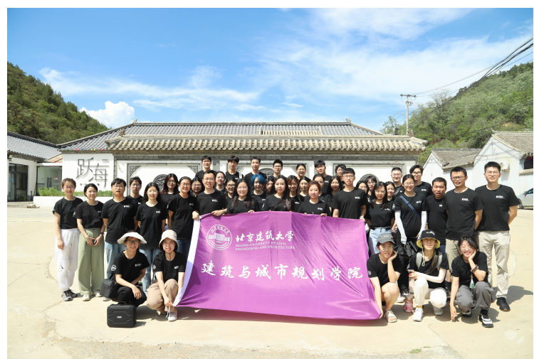
建筑学院“乡慈守护”专项行动实践团深入密云区中国传统村落的80余处农院落开展调查研究,用行动守护美好乡慈。