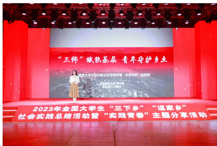
2023年全国大学生“三下乡”“返家乡”社会实践总结暨“实践青春”主题分享活动在北京建筑大学举办。