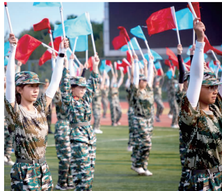
(姚青媛/文 刘子通 闫彭岳/摄)