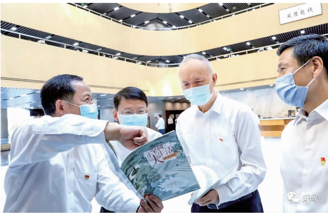
察看百姓身边微空间改造系列行动计划成果。