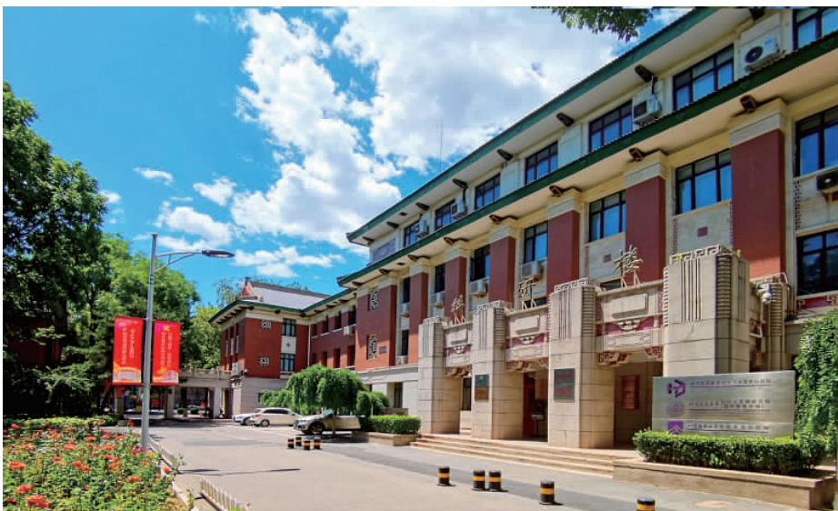
《建夏——科研楼》 (田振宽)