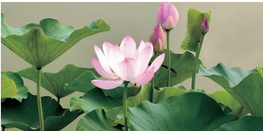
《夏之花——荷花》 (魏洋洋)