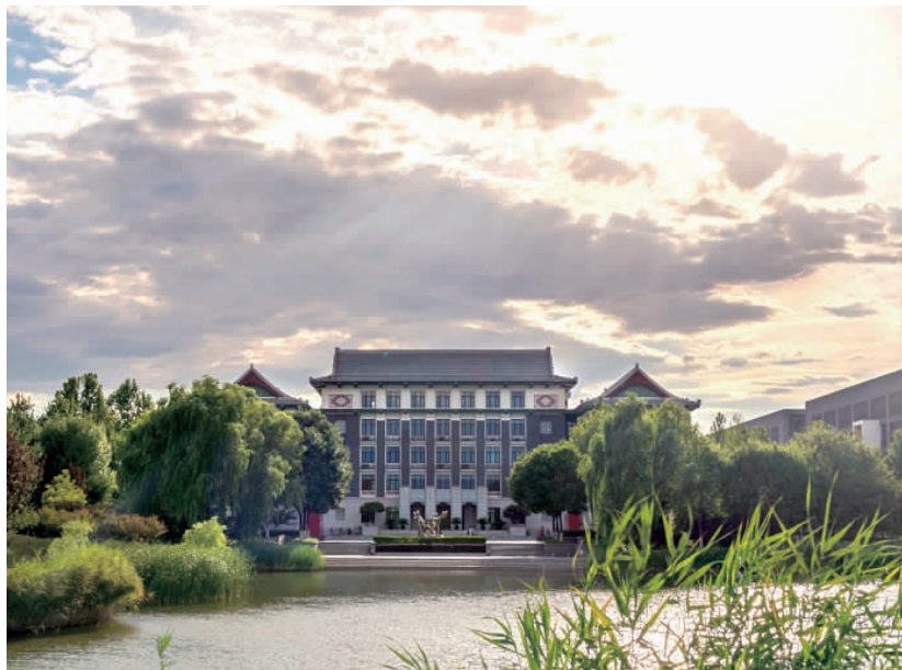
《北建之夏——夕阳中的行政楼》 (毕智凯)