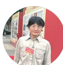
季节 土木与交通工程学院院长

学校第二次党代会的顺利召开,是全体北建大人继往开来奋进的成功号角。建筑学院将深入学习贯彻大会精神,牢记学校发展新目标新使命,以立德树人为根本任务,坚持高质量党建引领高质量发展,突出特色高校的优势专业,持续激发师生奋勇争先的活力、增强师生科技创新的实力、提升师生实现自我价值的潜力,将服务首都融入学院事业发展全过程,不断开创服务首都建设发展的新局面,为全面推动学校高质量发展,全面建成扎根京华大地的国内一流、国际知名高水平特色型大学贡献力量!