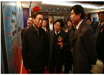
市委常委赵凤桐参观我校科技成果展览