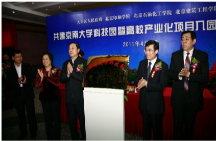
市领导为“京南大学科技园”揭牌

签约仪式后,市领导和大兴区领导参观了三所学校的科技成果展览。在参观我校展览时,市委常委、市委教育工委书记赵凤桐与具体项目负责人进行了亲切交谈,了解他们正在做的科研项目及取得的成果,对我校科研工作在服务首都城乡建设中所作的贡献给予了充分肯定。 (宣传部)